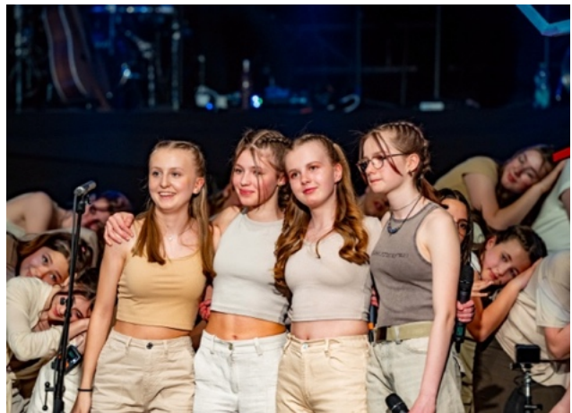
Bildnachweis: Thomas Moor /dorfheftli.ch Jugendchor Seetal

Wir reden nicht von Jugendarbeit, wir leben sie!